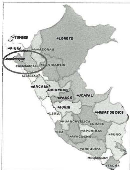
IMAGEN N° 01: UBICACIÓN DEL DEPARTAMENTO DE LA LIBERTAD