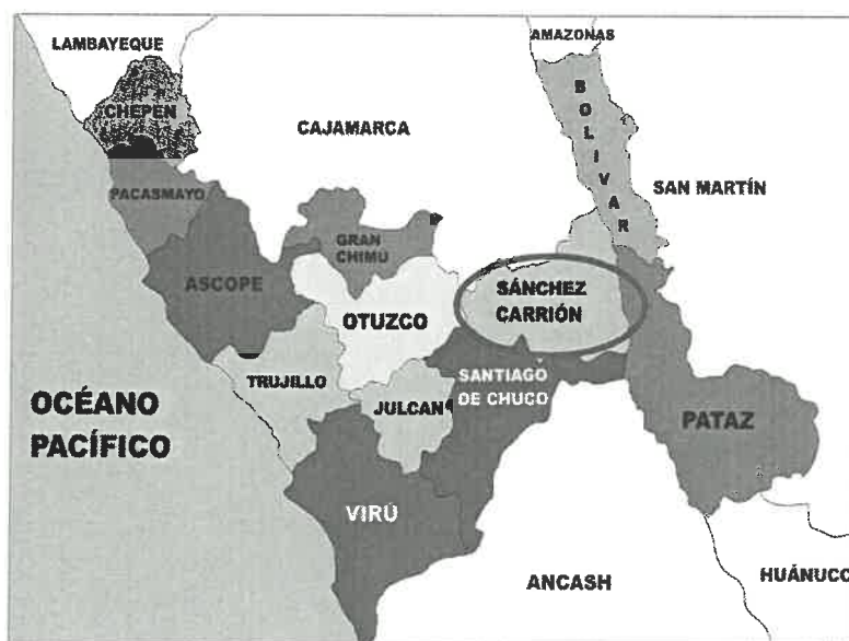
IMAGEN N° 02: UBICACIÓN DE LA PROVINCIA DE SÁNCHEZ CARRIÓN