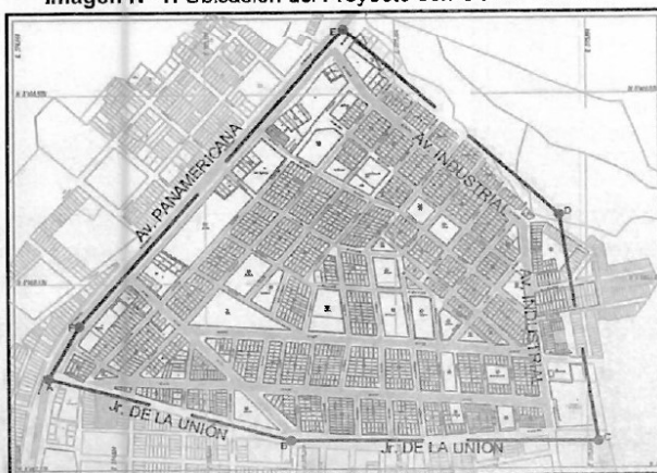
Imagen N° 1: Ubicación del Proyecto con CUI N° 2483127.

Departamento : Ica Provincia : Pisco Distrito : San Clemente Sector : Asociación Ejercito de Salvación