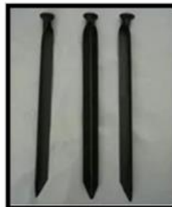
Estacas de acero en ángulo