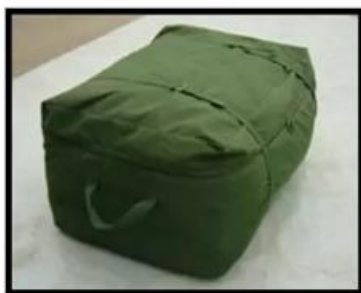
Paquete de transporte de las telas plastificadas de PVC