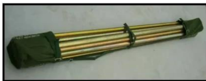
Paquete de transporte parantes de base de Acero