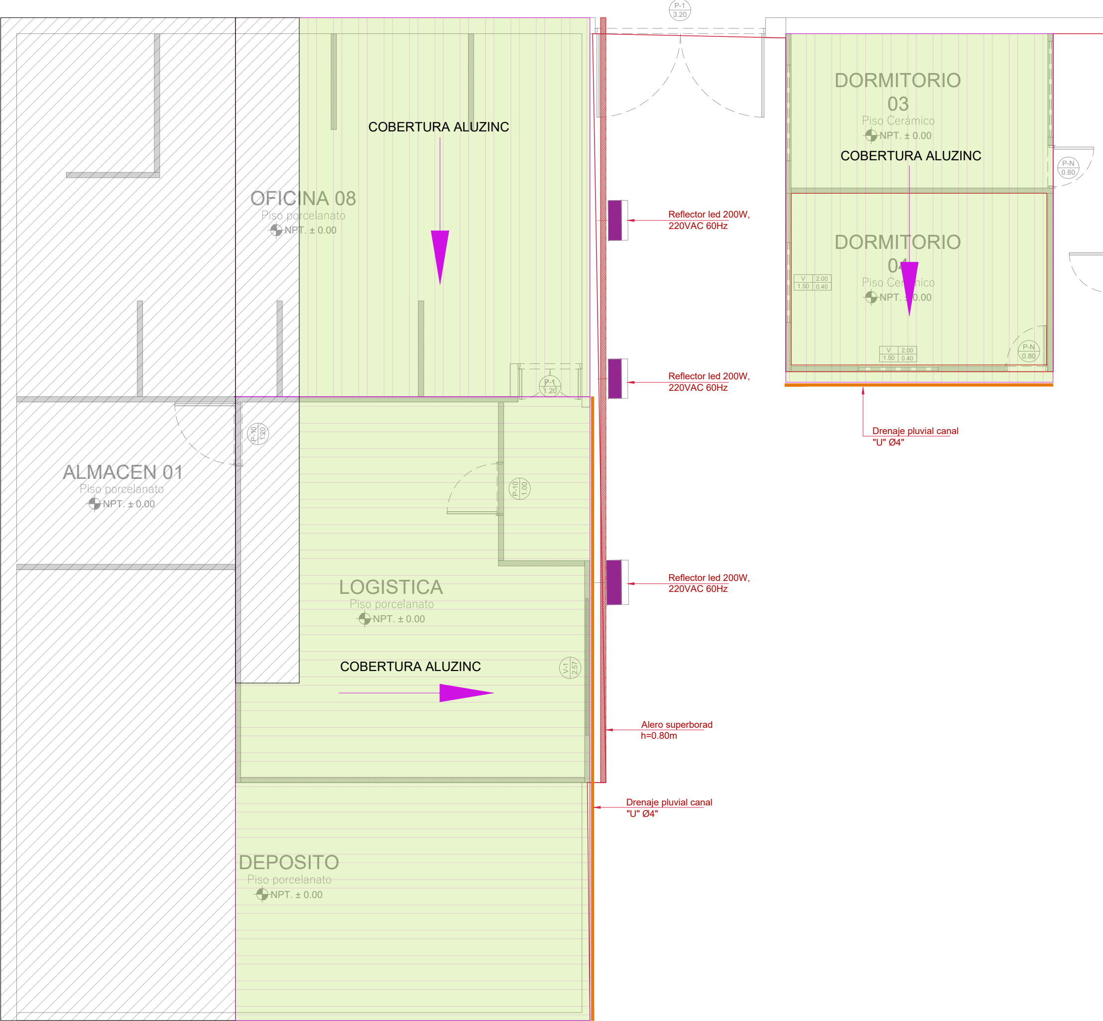
PLANO PRIMER NIVEL ESC:1/50