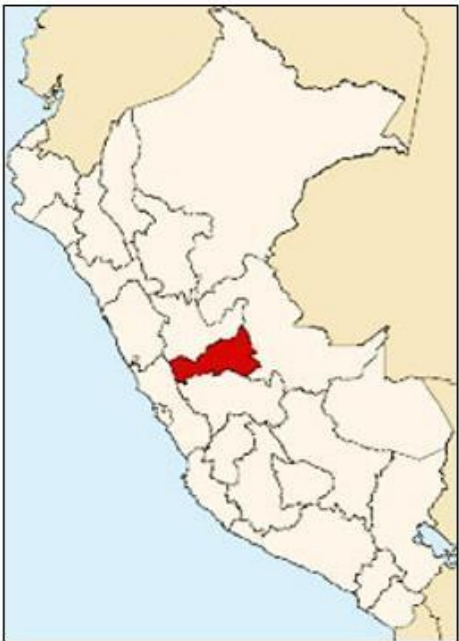
A NIVEL NACIONAL