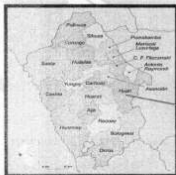
DEPARTAMENTO DE ANCASH