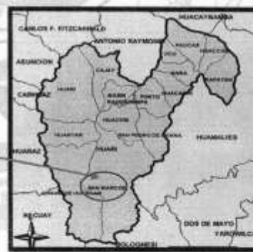
DISTRITO DE SAN MARCOS