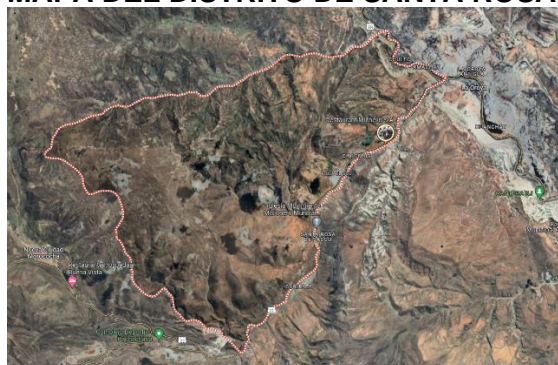
MAPA SATELITAL DISTRITAL DE SANTA ROSA DE SACCO