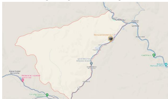
MAPA DEL DISTRITO DE SANTA ROSA DE SACCO