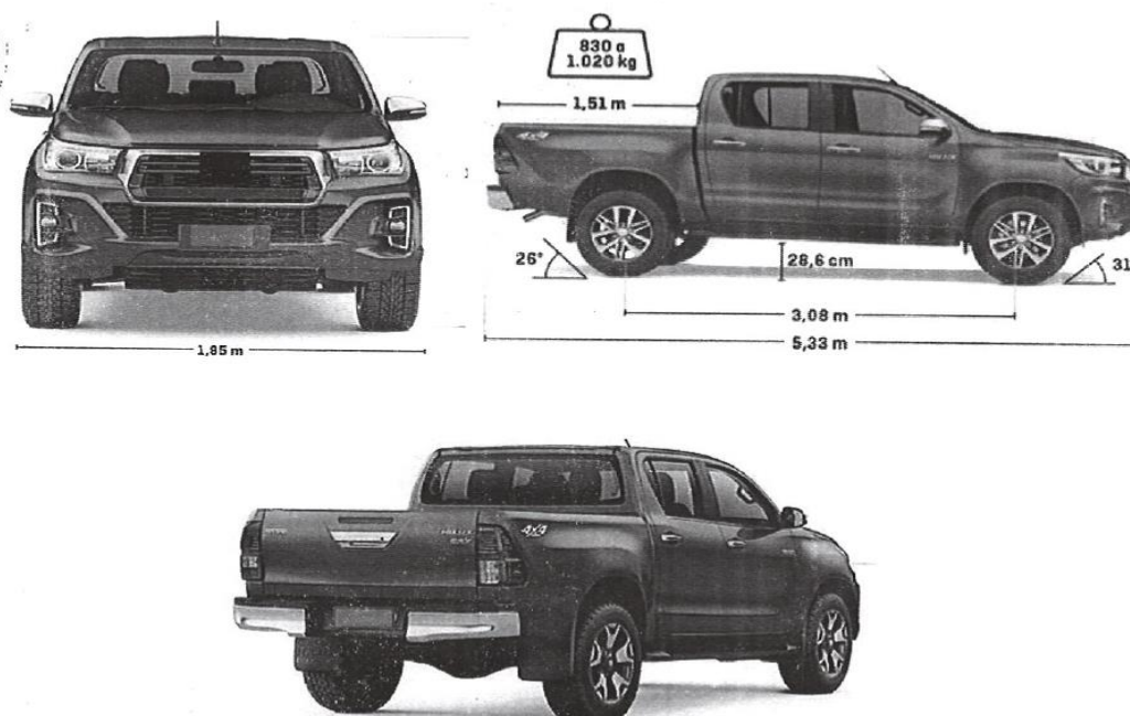
CAMIONETA PICK UP 4X4 FULL EQUIPO (COLOR BLANCO)