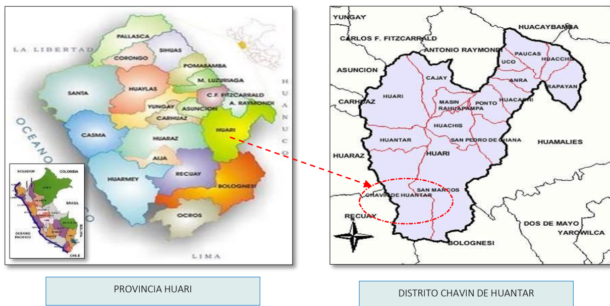
Imagen N°02: Micro localización de la zona del proyecto