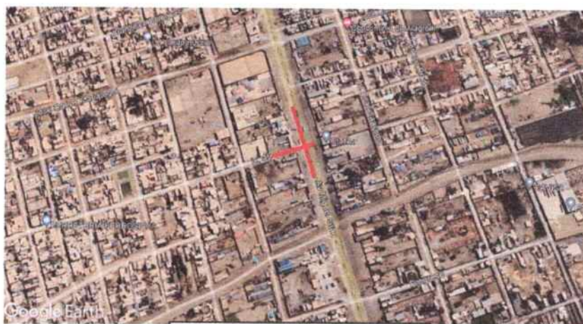
Área de Estudio