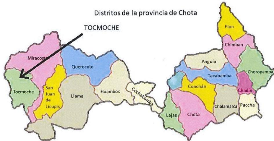
Distrito de Toccoche

En el presente proyecto se encuentra ubicado en las siguientes localidades