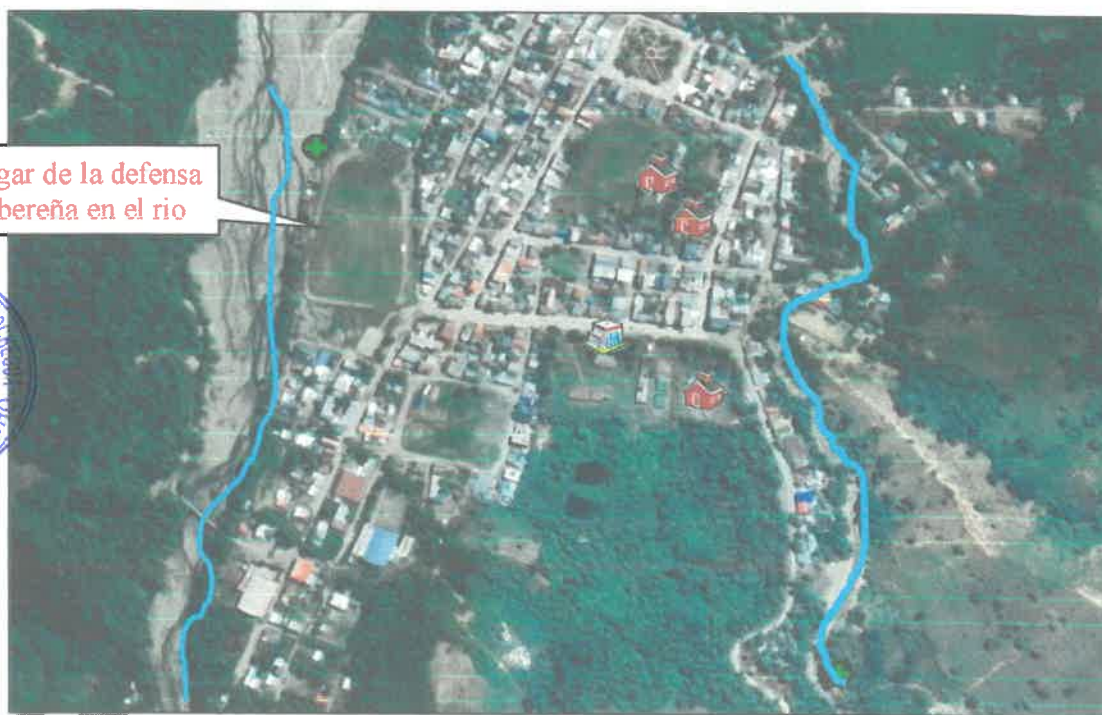
Figura 1. Vista Satelital del Área de Estudio