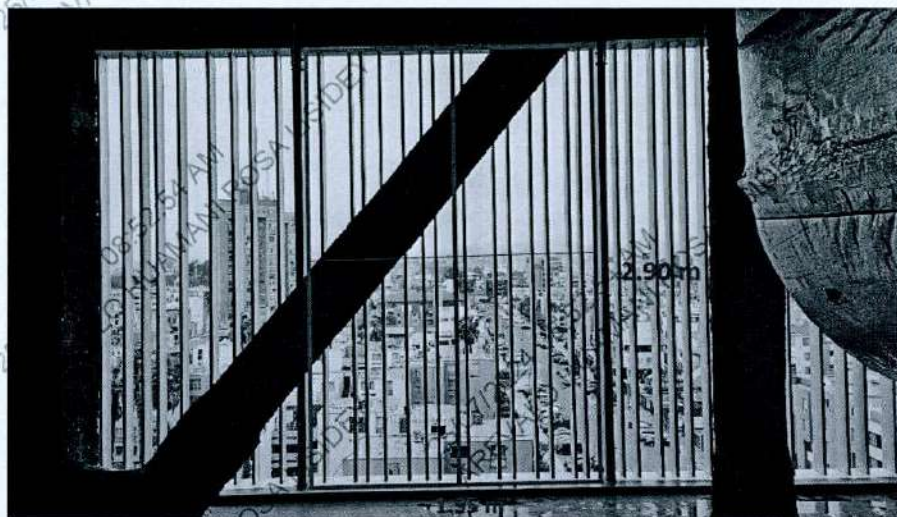
Fotografía del área de trabajo

Marco y división intermedia con tubo de aluminio de 2" x 2" (bastidor), a instalar en módulos de rejas existentes