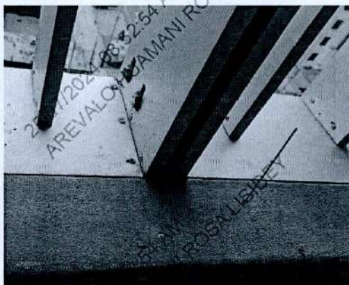
Fig.2 : Zócalo de cemento al cual se fijarán las platinas ó sujetadores del bastidor mediante tuercas y huachas, al espárrago insertado al cemento con aditivo epóxico.