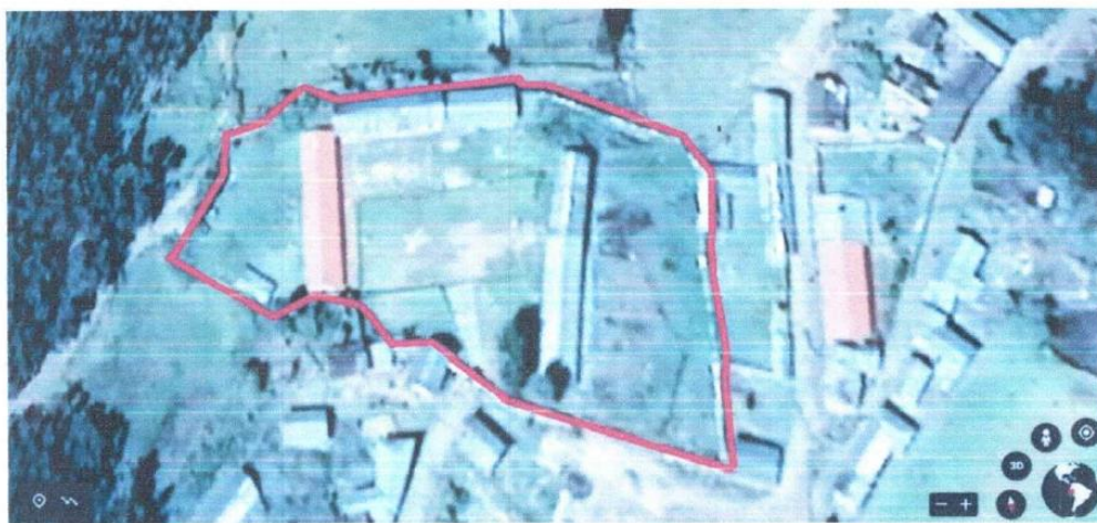
IMAGEN REFERENCIAL- INSTITUCIÓN EDUCATIVA N 88187