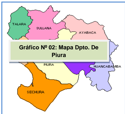
Gráfico N° 02: Mapa Dpto. De Piura