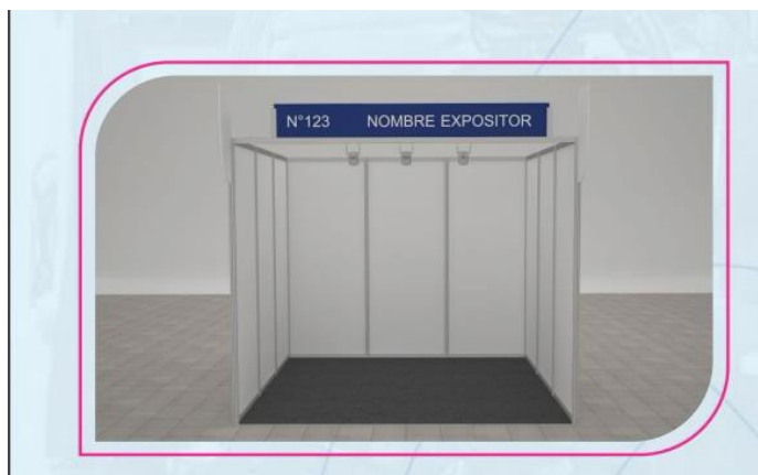
* Visual del stand