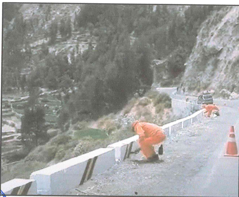
Imagen referencial N°03

Fondo blanco y líneas de color negro y amarillo.