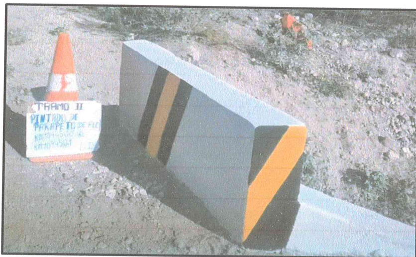
Imagen referencial N°02

Se pintará el parapeto de alcantarilla y aleros, según la imagen referencial N°02.