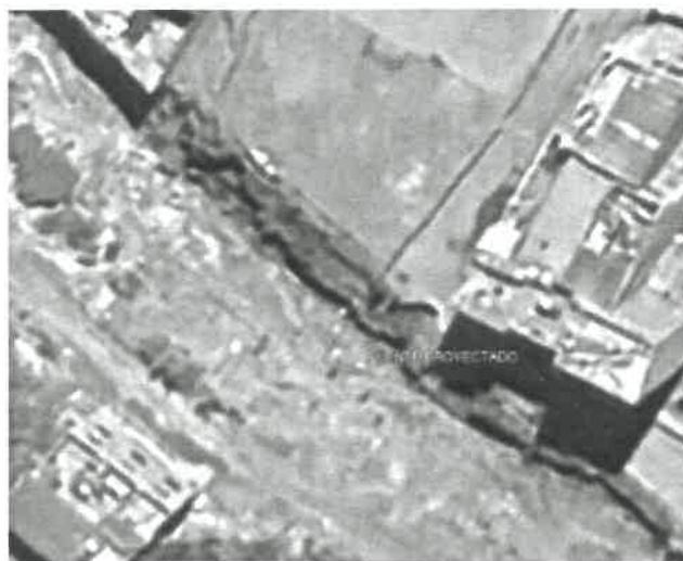
Ilustración 1: MICRO LOCALIZACIÓN DEL PROYECTO

REGIÓN : ANCASH PROVINCIA : HUARAZ DISTRITO : HUARAZ