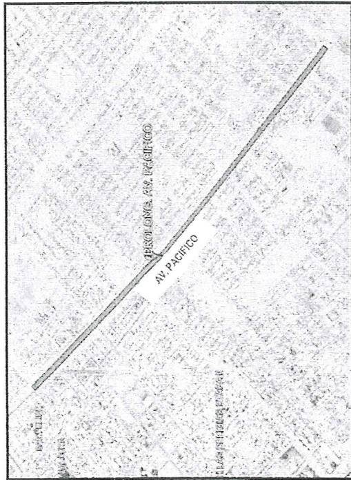
Imagen 01. TRAMO DE AVENIDA PACIFICO DESDE AV. CHINECAS HASTA LA CALLE 19 (AA.HH. VILLA ATAHUALPA) DEL DISTRITO DE NUEVO CHIMBOTE

Además, sus principales vías de acceso son por la Prolongación de la Av. Pacifico, accediendo hacia la zona en autos, camionetas, buses medianos, buses grandes, camiones, motos de transporte público, entre otros.