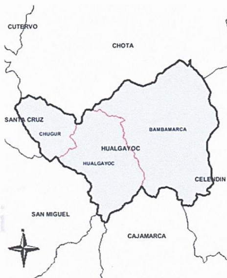
FIG. 02: PROVINCIA DE HUALGAYOC

"Año del Bicentenario, de la consolidación de nuestra Independencia y de la conmemoración de las heroicas batallas de Junín y Ayacucho"