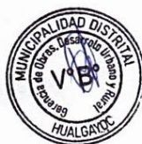
Fig. 03 DISTRITO DE HUALGAYOC