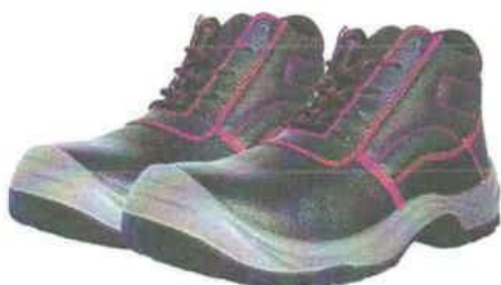
ZAPATOS DE SEGURIDAD TRABAJO – SEGURIDAD

INSTITUTO DE VIALIDAD MUNICIPAL DE LA PROVINCIA DE CAJABAMBA AÑO 2024