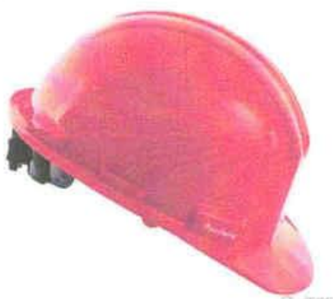
CASO DE SEGURIDAD