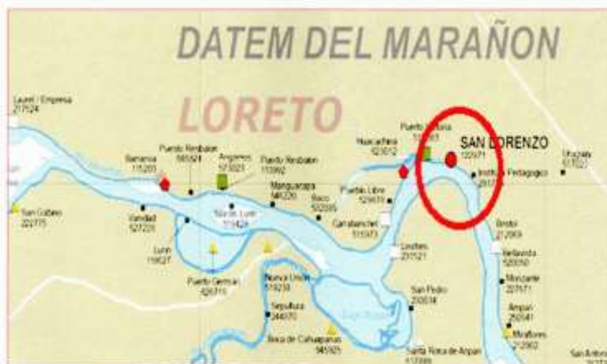
Figura N°02: Microlocalizacion del Proyecto

Región : Loreto. Provincia : Datem del Marañón. Distrito : Barranca. Localidad : San Lorenzo. Zona : Urbana. Región Natural : Selva. Coordenadas UTM : N= 9467068.01 E= 326803.53