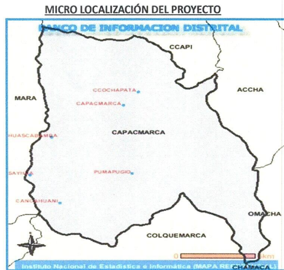
figura 1 ubicación del proyecto