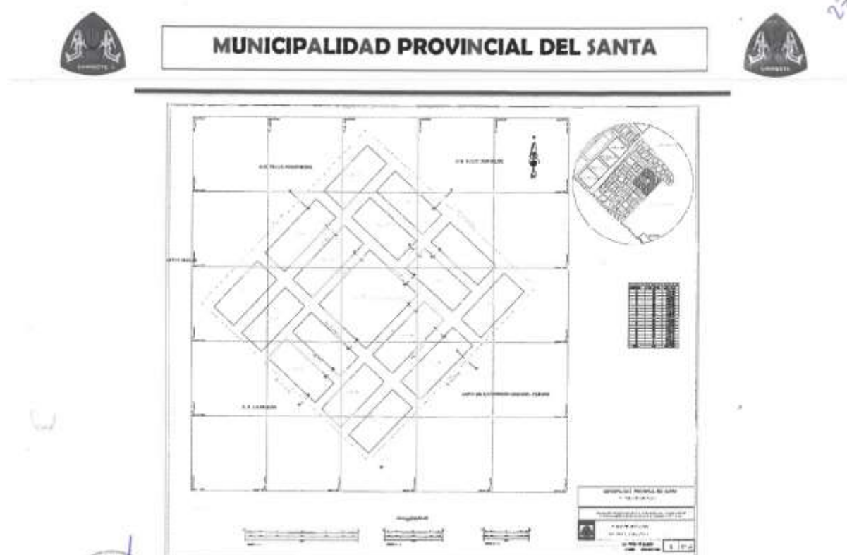
Imagen N°02.- Plano de Ubicación del Proyecto - A.H. Teresa de Calcuta, Npo. Chimbote.