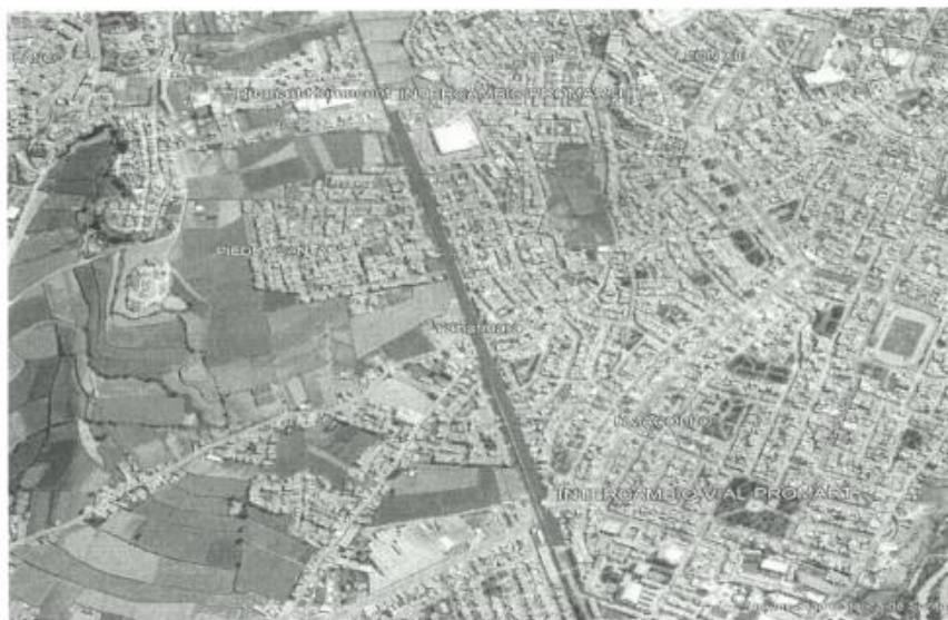
UBICACIÓN DE LA ZONA A INTERVENIR

Municipalidad Provincial de Arequipa, Sede principal: Calle el Filtro 501 Palacio Municipal: Portal de la Municipalidad 110, Plaza de Armas Álvarez Thomas 312, cercado Av. Parra 202, con atención a la Subgerencia de Formulación de Proyectos de Inversión, por mesa de partes.