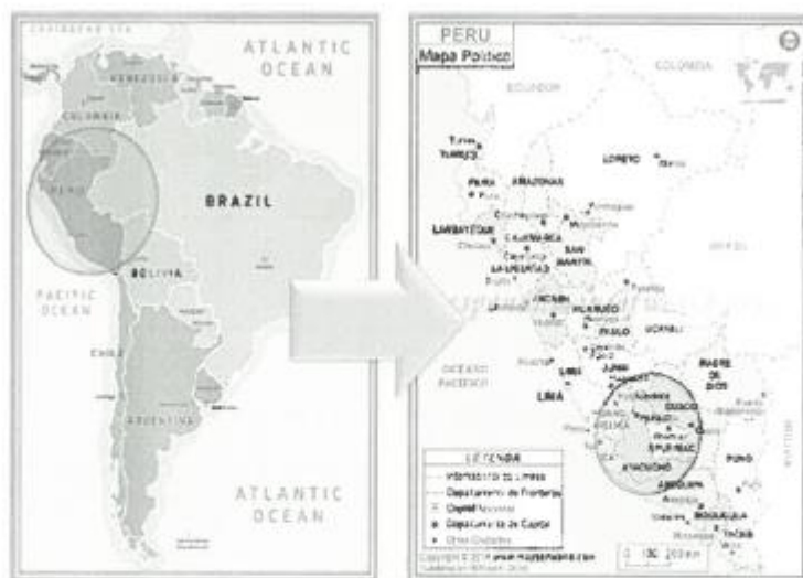
FIGURA Nº 01 - MAPA DE UBICACIÓN MACRO