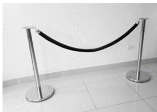
(*) Imagen Referencial de lo solicitado