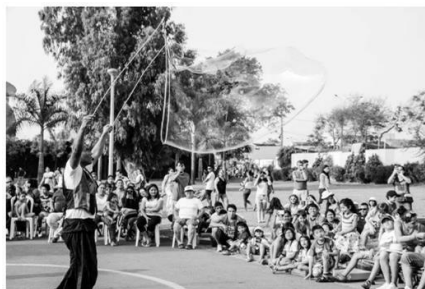
IMAGEN REFERENCIAL DEL SHOW DE BURBUJAS REQUERIDO POR PROMPERÚ