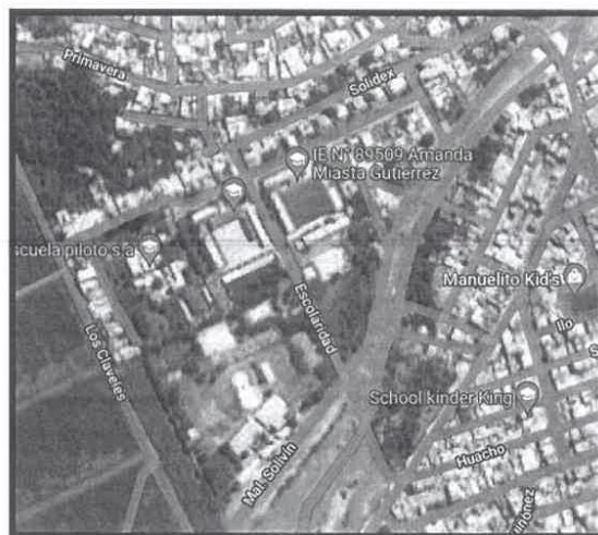
Imagen 01 - Vista satelital de la localización del proyecto.