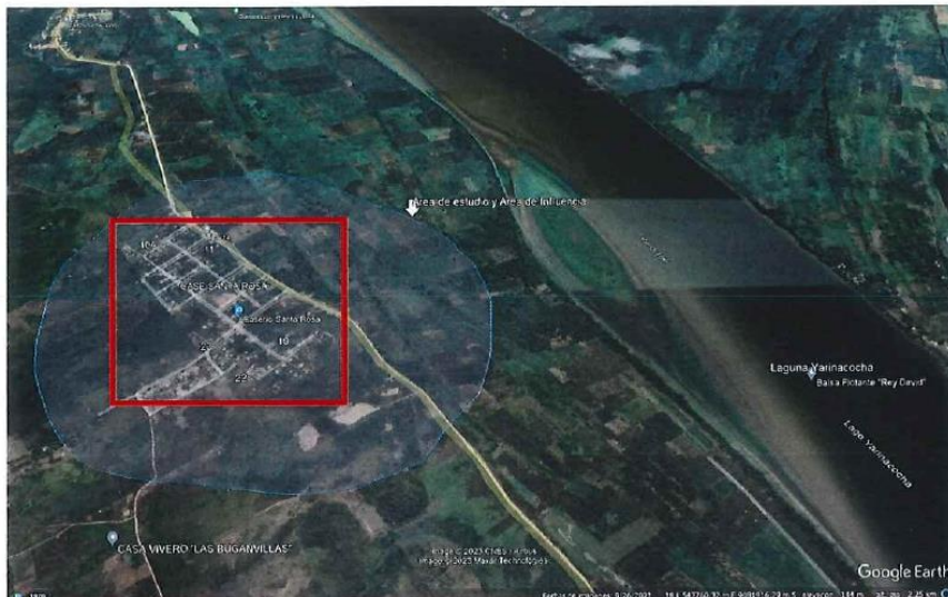
Google Earth Vista Satelital de la Ubicación del Caserio Santa Rosa