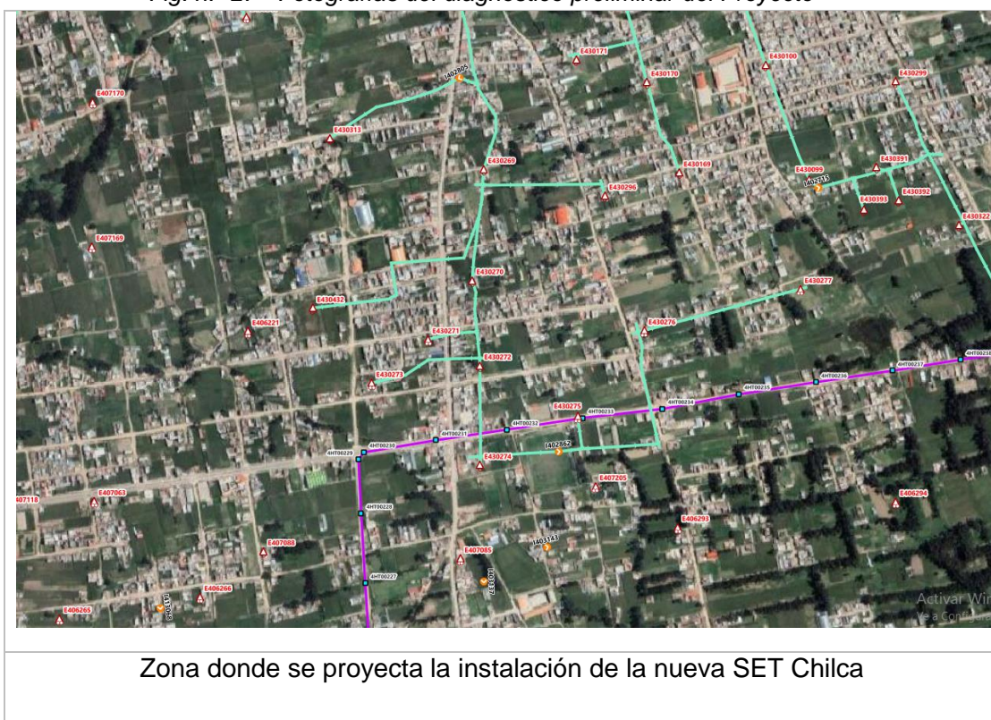
Fig. n.º 2. Fotografías del diagnóstico preliminar del Proyecto

Los posibles terrenos donde se instalará la nueva SET Chilca, están ubicados en el distrito