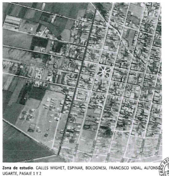
Zona de estudio. CALLES WIGHET, ESPINAR, BOLOGNESI, FRANCISCO VIDAL, ALFONSO UGARTE, PASAJE 1 Y 2