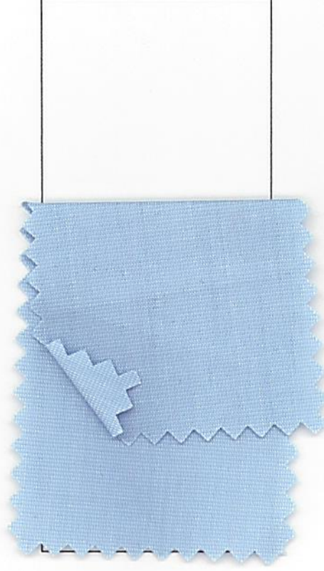
Tela Blusa Damas y Camisa Caballeros