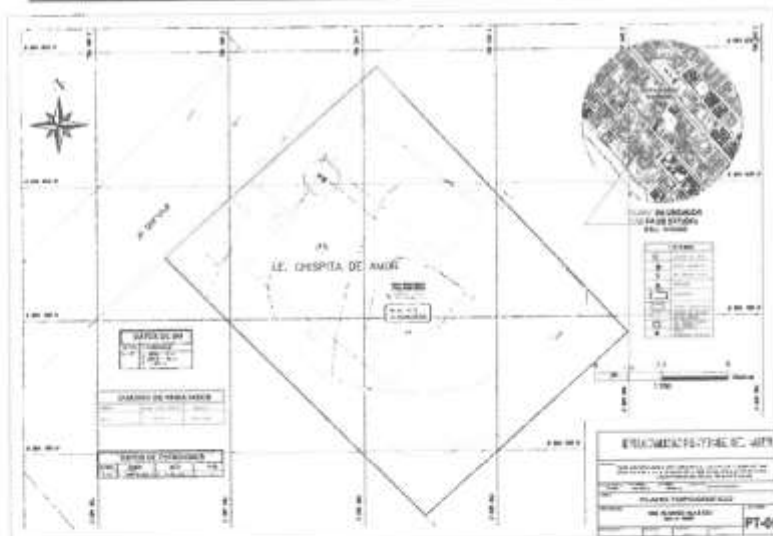
Imagen 01 – Plano de Ubicación del Proyecto.