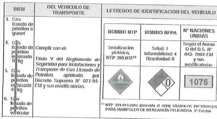
Imagen extraída de los Documentos de Información Complementaria del Listado de Bienes y Servicios Comunes, del rubro Combustibles, aditivos para combustibles, lubricantes y materiales anticorrosivos:

La unidad de transporte deberá cumplir con la regulación específica según el bien del rubro Combustibles, aditivos para combustibles, lubricantes y materiales anticorrosivos, a transportar: