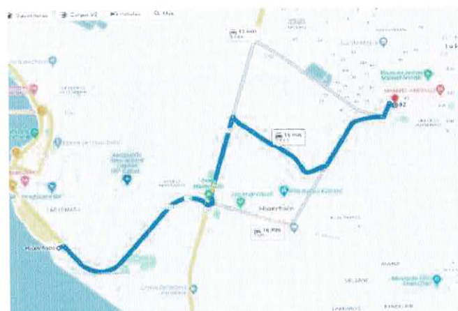
Imagen 2: Accesibilidad desde la municipalidad de huanchaco hasta el proyecto.