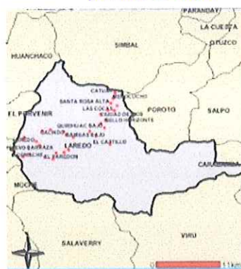
Ilustración 4: Mapa del distrito de Laredo