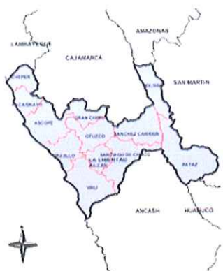
Ilustración 2: Mapa del departamento de La Libertad