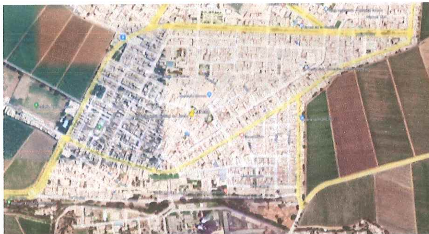
Ilustración 5: Distrito de Laredo