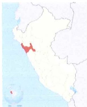
Ilustración 1: Mapa macro de la localización del Perú