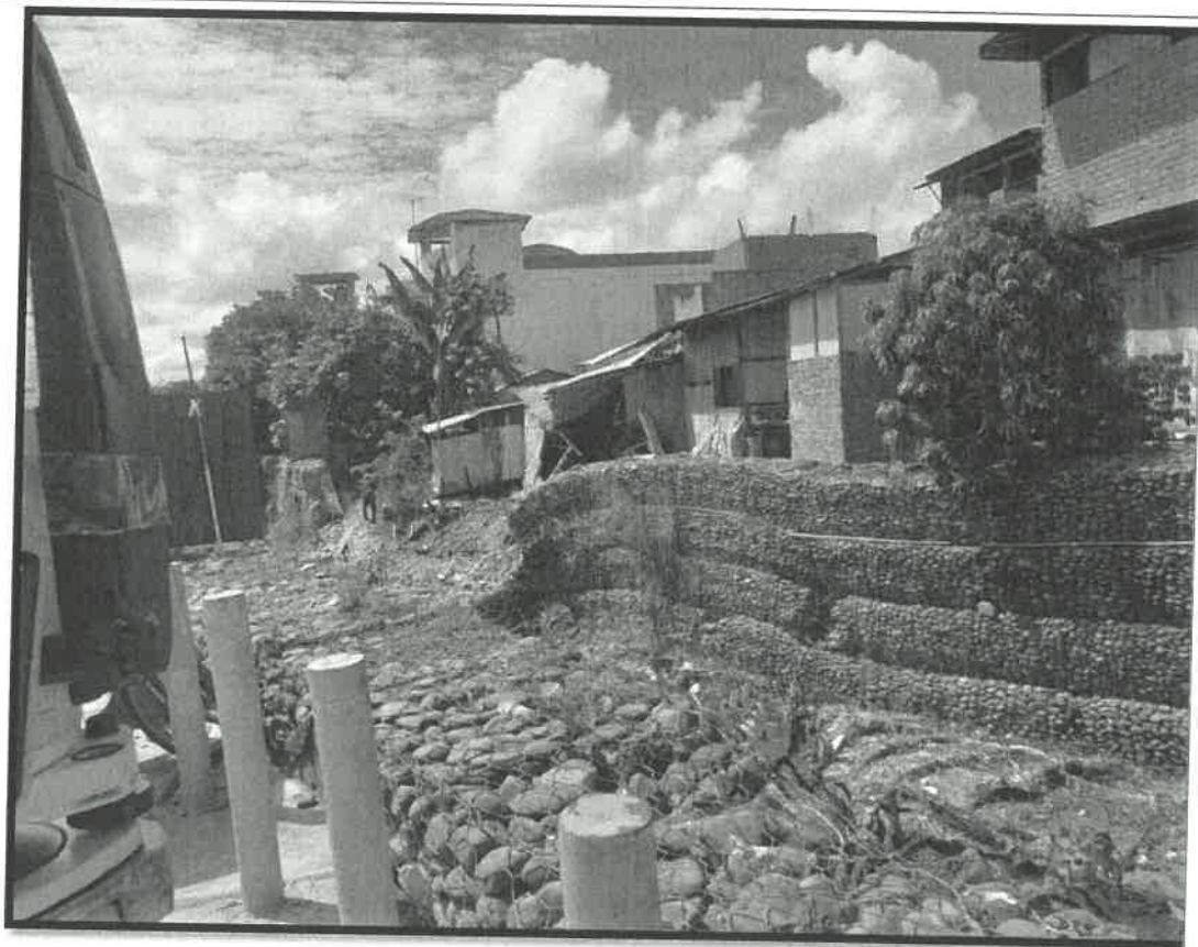
Vista fotográfica de la Quebrada Campo Plata – Muros Desplomados