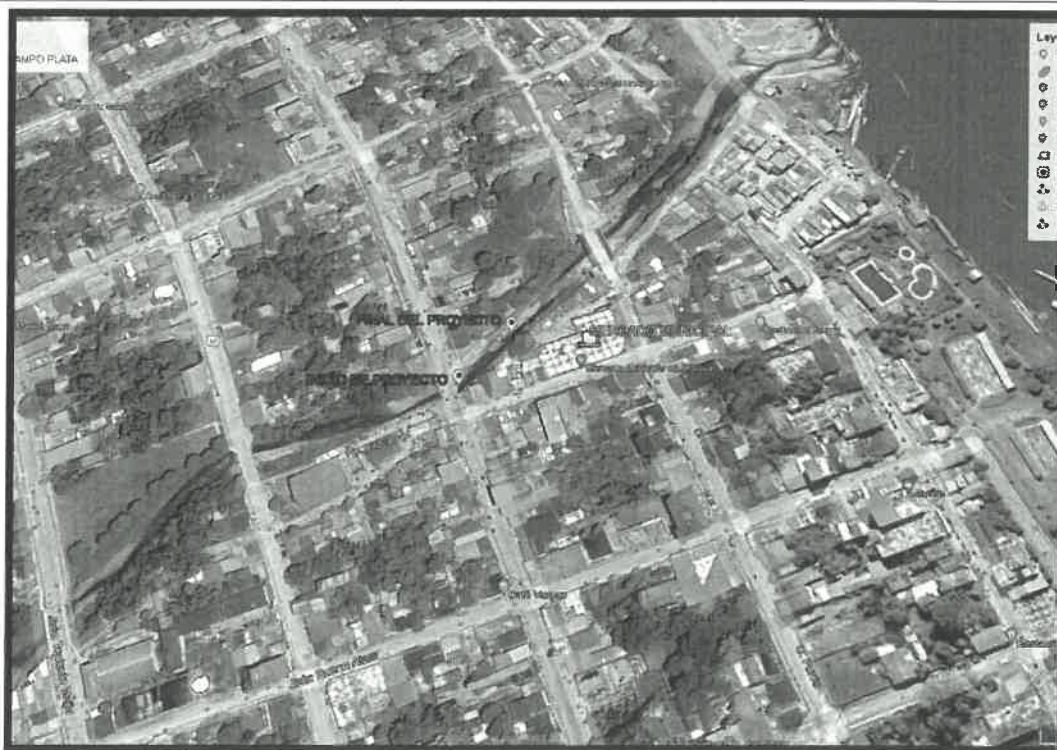
Imagen N°03: Mapa de micro localización del terreno para el proyecto con el Centro de la Ciudad.