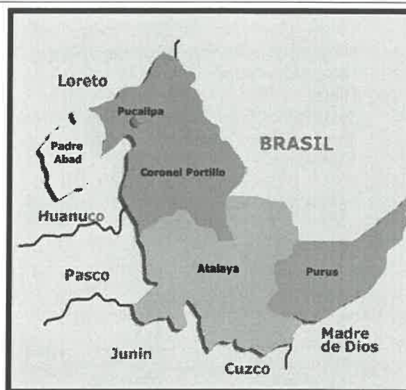
Imagen N°02: Mapa de macro localización del Departamento de Ucayali