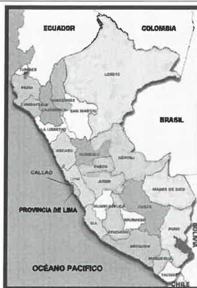
Imagen N°01: Mapa de macro localización del Perú

Decreto Ley N° 23416 del 1° de junio de 1,982 se creó la Provincia de Atalaya, manteniendo a la localidad de Atalaya como su capital, que ascendió al rango de Villa.