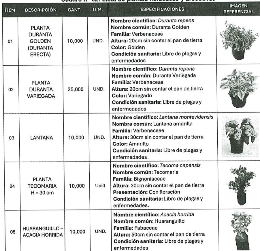
Cuadro N° 02: Lista de plantas herbáceas y arbustivas

Las cantidades señaladas en los Cuadros N° 01 y 02 para cada ítem, podrán variar a solicitud del Coordinador de Áreas Verdes, conforme al procedimiento establecido en los numerales 7.9.2 y 7.9.3 de las especificaciones técnicas, manteniéndose dentro del monto contractual.