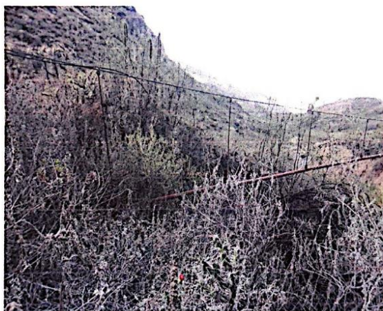
Ilustración 05: Pase aéreo – Tubería dañada