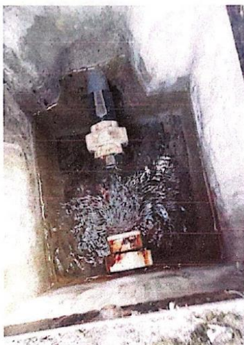
Ilustración 03: Cámara de válvula de control