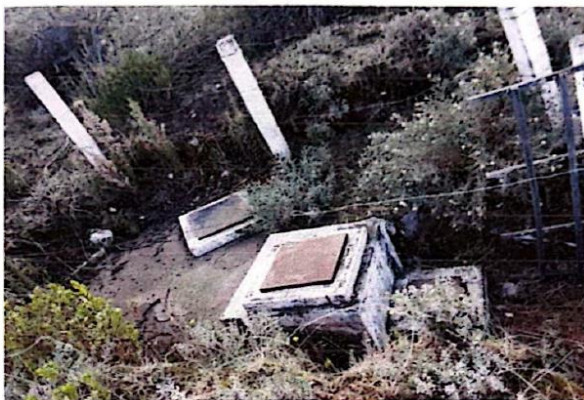
Ilustración 01: Captación Chorjo – vista general

Al interior de las estructuras que contienen agua, así como las tuberías y accesorios: se hallaron cubiertas con moho, y sedimentos de material inorgánico. De igual manera, la válvula de compuerta se encontraba oxidada y en pésimo estado.