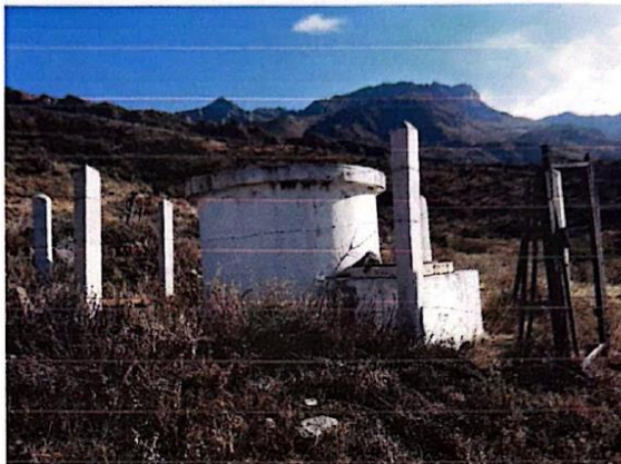
Ilustración 08: Reservorio Huasicac – vista general

Si todo lo dicho líneas arriba, fuera poco, el reservorio no posee "sistema de cloración", es decir, que los pobladores consumen el agua "sin desinfección" previa.