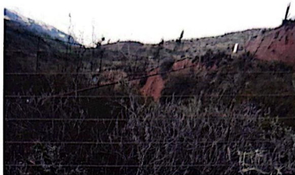
Ilustración 04: Pase aéreo – Postes de sostenimiento.

La tubería existente presenta además del deterioro diversas fugas por lo cual es necesario su reconstrucción.