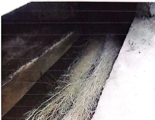
Ilustración 02: Cámara de captación de caudal

"UNIDAD DE DESARROLLO URBANO Y OBRAS PUBLICAS" MUNICIPALIDAD DISTRITAL DE MACHAGUAY