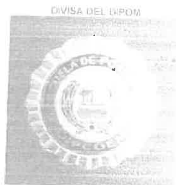
IMAGEN REFERENCIAL DEL BIEN