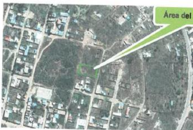
Imagen n° 04. Imagen satelital de la ubicación de I.E.I. N° 432-170/Mx-U