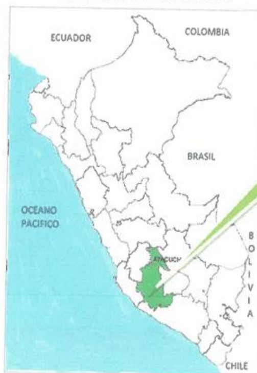
Imagen n° 01. Mapa de macro localización