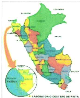
MAPA POLITICO DE PIURA