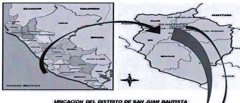
UBICACIÓN DEL DISTRITO DE SAN JUAN BAUTISTA

Localidad: Centro Urbano de San Juan, CP el Limón, CH La Angostura, CP San Martín, sector 1 y 2 Los Patos Distrito: San Juan Bautista Provincia: Ica Departamento: Ica