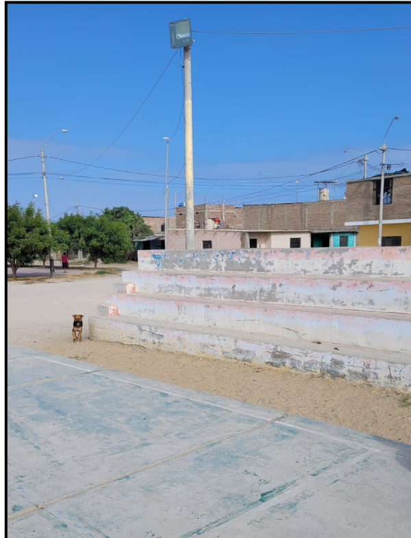
Imagen N°03: Arco y Tablero deteriorado