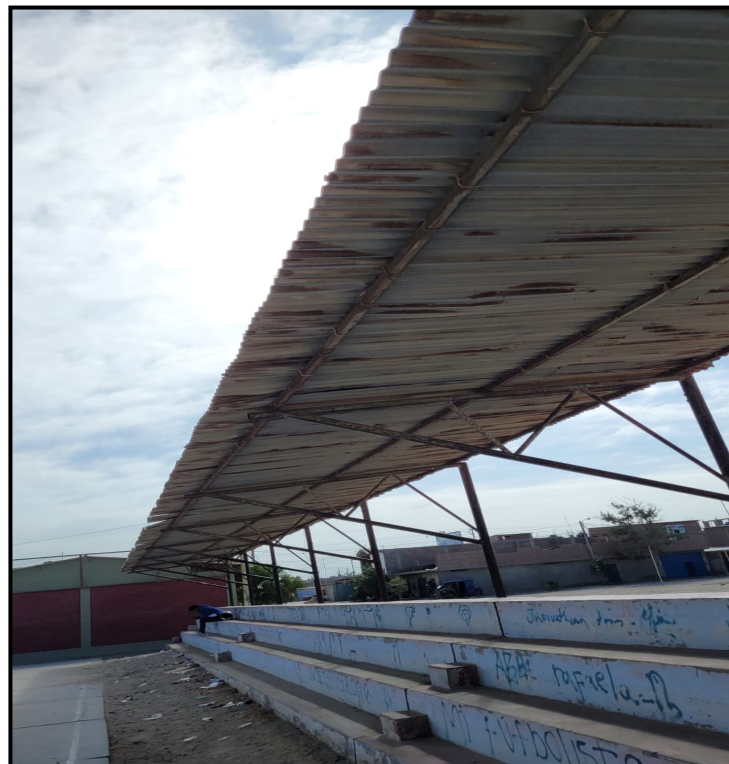
Imagen N°01: Cubierta oxidada

Después de realizar la visita de inspección correspondiente, se pudo constatar que la cubierta de las tribunas su estructura esta oxidada y la calamina deteriorada, la pintura de las tribunas y losa esta desgastada, así mismo el mobiliario de la plataforma, los arcos están oxidados y los tableros desgastados lo cual impide el óptimo desarrollo de las actividades recreativa.