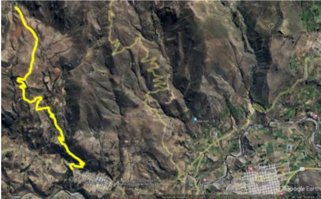
Imagen N°02: Trayecto de Ichupampa al reservorio de Ancashi Cucho