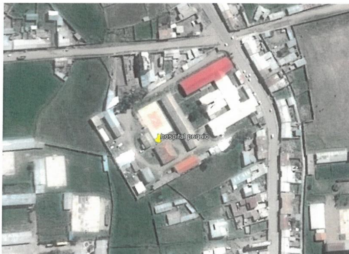
Fotografía N° 2: Vista aérea del Hospital de Puquio

El terreno mencionado presenta un área total de 13,883.40m 2 según partida registral de la SUNARP; según el levantamiento topográfico realizado en el mes de marzo del 2019 el terreno presenta un área de 14,025.83m 2 y un perímetro de 485.95 ml. El Hospital Felipe Huamán Poma de Ayala se encuentra en un terreno llano con pendientes suaves no mayores a 5%-6%