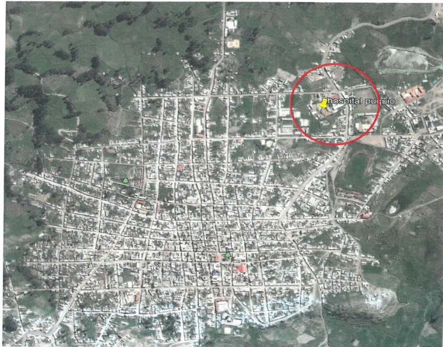
Fotografía N° 1: Vista aérea del Hospital de Puquio (círculo rojo)