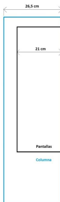
Figura N° 02