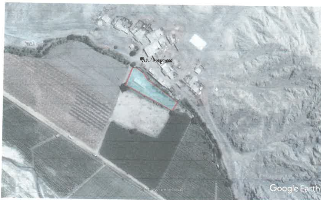
GRAFICO N° 05: IMAGEN SATELITAL (AREA A INTERVENIR)

CONSTRUCCION DE CERCO PERIMETRICO; EN EL(LA) IE 21585 - SUPE DEL CENTRO POBLADO LLAMAHUACA, DISTRITO DE SUPE, PROVINCIA BARRANCA, DEPARTAMENTO LIMA* CUI N° 2563443