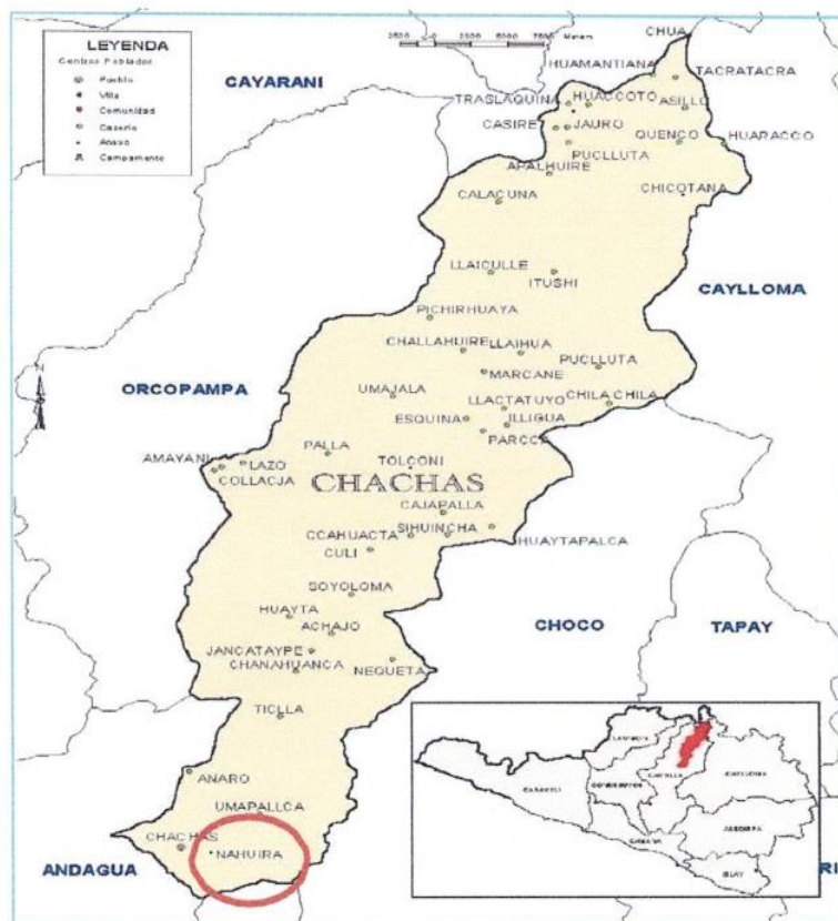
Mapa 1 Área de Influencia del proyecto