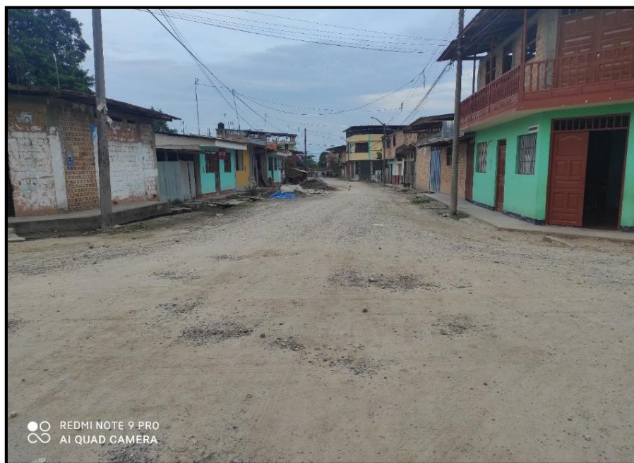
Jr. Ricardo Palma C 08 – No cuenta con drenaje pluviales, y se nota en las partes laterales de la calzada, las erosiones que provocan las aguas de lluvia acumuladas.