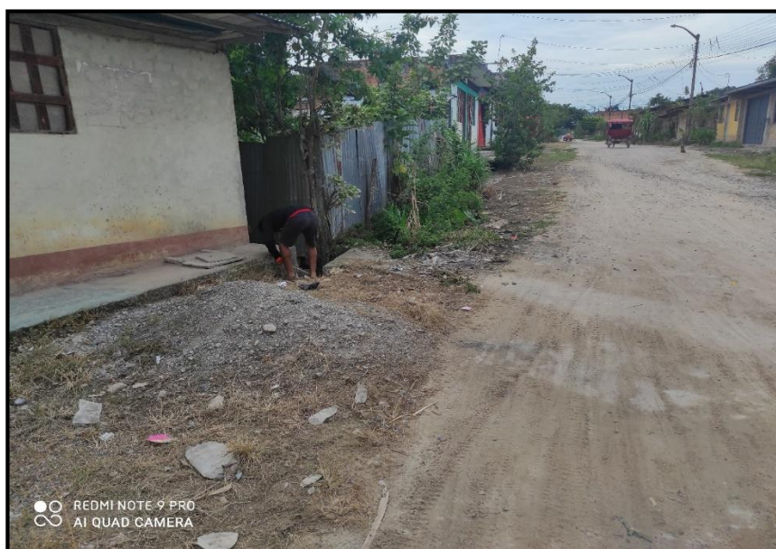
Jr. Bolognesi C 14 – Se puede demostrar en la presente imagen el mal estado en la que se encuentran la vía con drenaje deficiente, que no cumplen con las capacidades de entrega, causando que las precipitaciones afecten de manera directa al afirmado, generado deterioro en la vía.