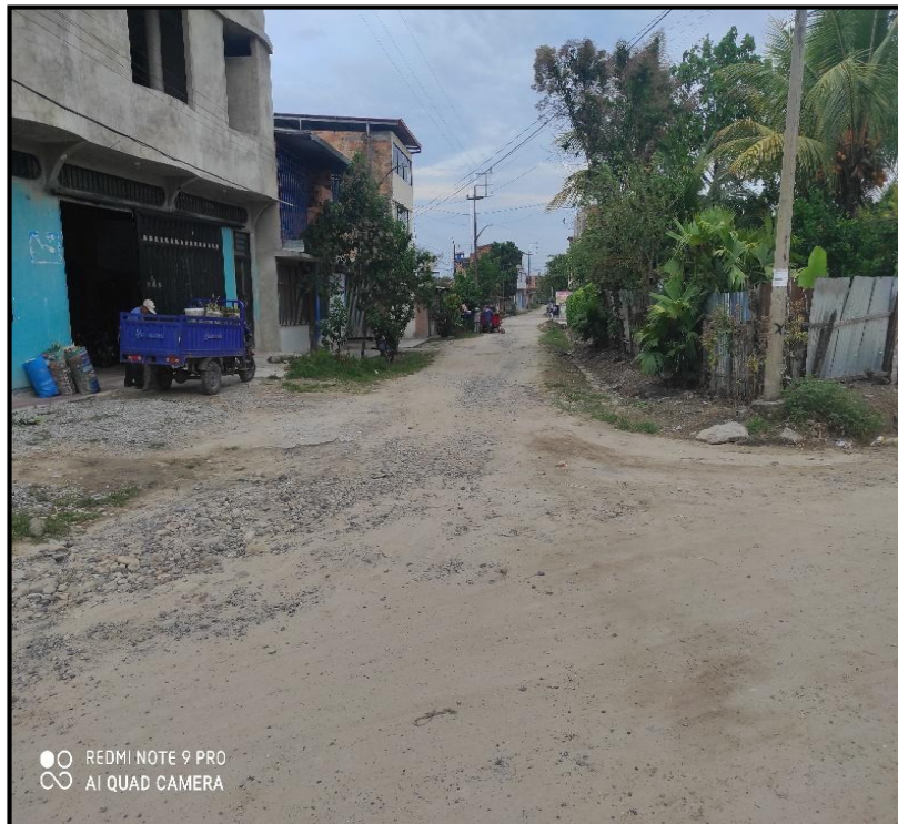
Jr. Atahualpa C-01 El sistema de drenaje es deficiente y no cumple con la función correctamente.