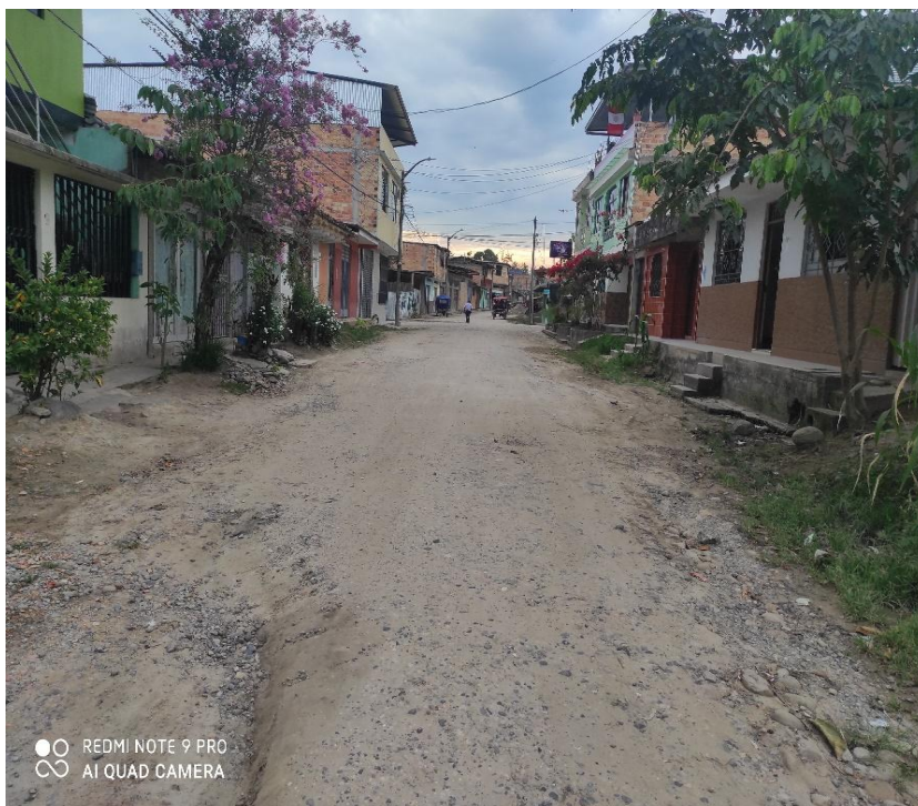
Jr. Ricardo Palma C 07 – Dicha calle no cuenta con un drenaje para las evacuaciones de las aguas de lluvia, y eso permite que se acumulen deteriorando la calzada, provocando intransitabilidad.