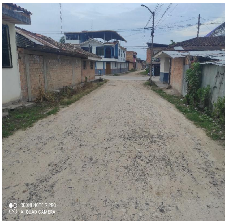
Jr. Ricardo Palma C 06 – En esta imagen también se puede observar la deficiencia de cunetas para el drenaje de aguas pluviales optimas.