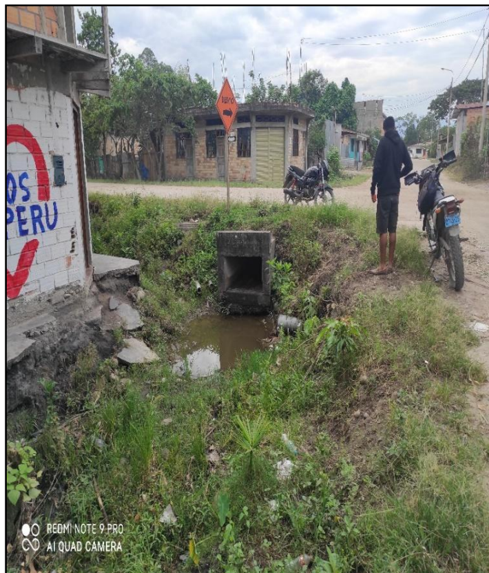
Jr. Bolognesi C 17 – En la siguiente imagen se puede demostrar los problemas de acumulación de aguas en las cunetas, provocando un problema de salubridad en el lugar.