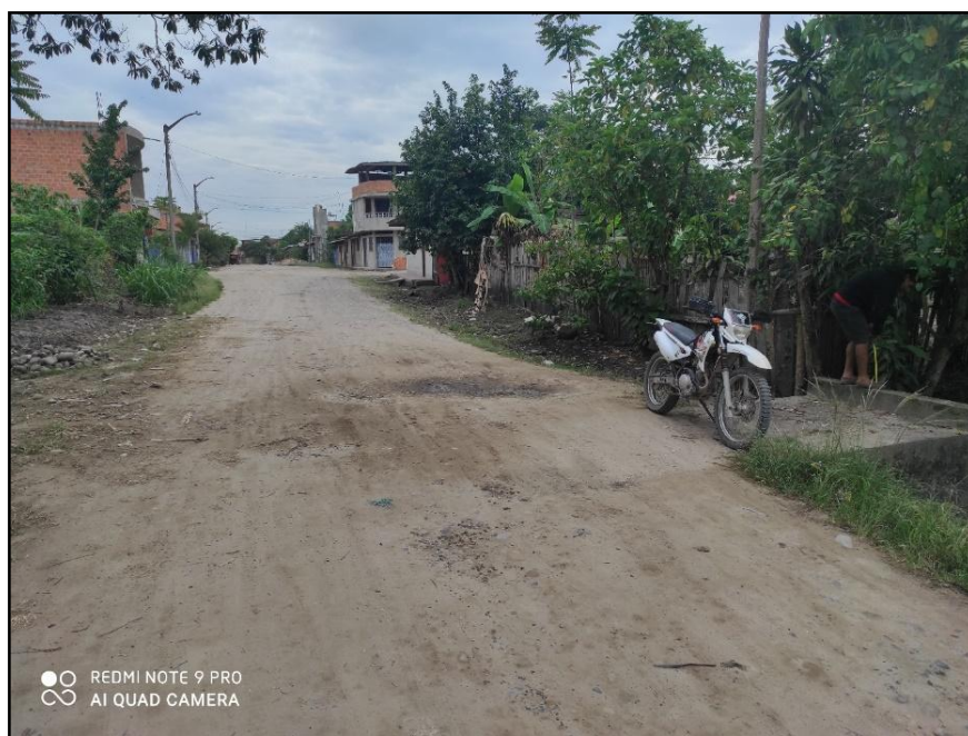
Jr. Bolognesi C 16 – En la siguiente imagen se puede demostrar los problemas de deterioro de las vías por la acumulación de las aguas en la parte de la calzada.