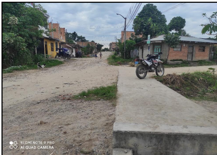
Jr. Bolognesi C 15 – En la presente imagen se observa el deterioro de la vía por la ausencia de un drenaje pluvial óptimo, haciendo que el agua de lluvia se estanque y provoque erosiones.