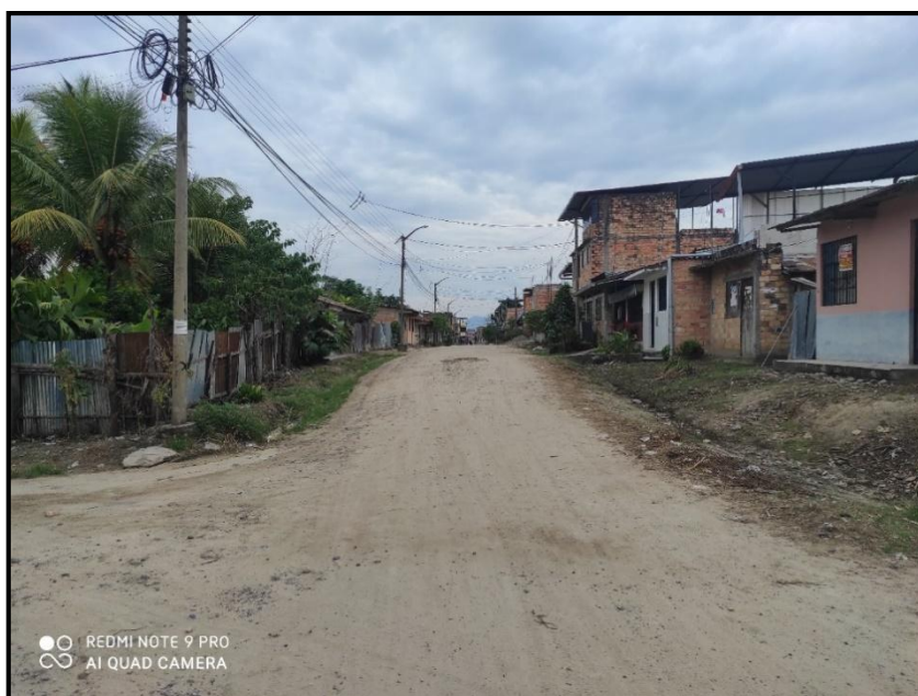
Jr. Bolognesi C 13 – Se aprecia el estado en deterioro en la que se encuentra la vía correspondiente, y también se puede observar la carencia de un drenaje pluvial.